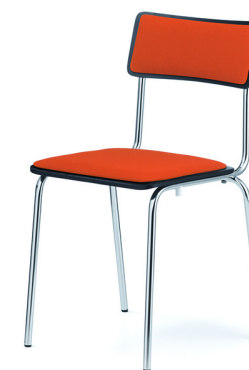
Sitz & Rücken gepolstert